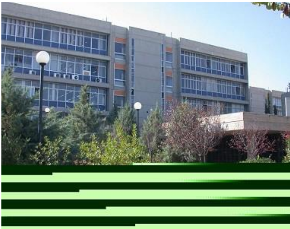
Κτήριο Σ.Ε.Μ.Φ.Ε. Πολυτεχνειούπολη Ζωγράφου

Επιπλέον, οι φορείς υποδοχής (ΦΥ) ασκουμένων μέσω της διαδικασίας αυτής μπορούν να αξιοποιήσουν τη δυνατότητα να επιλέξουν αργότερα το προσωπικό τους μέσα από επιστήμονες με εξειδικευμένες γνώσεις, λόγω της υψηλής στάθμης των παρεχόμενων από τη Σχολή σπουδών.